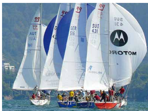
Segelparade: Noch liegt das Feld der X-99 Yachten eng beieinander.