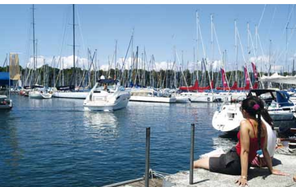
Genug Platz für Romantiker. Die Marina bietet auch ruhige Plätzchen.

Fürs leibliche Wohl und für stimmungsvolle Unterhaltung ist an beiden Festtagen ebenfalls gesorgt. Neben dem Angebot der Restaurants in der Marina, bieten die Köche des Skiverein Kressbronn Leckeres vom Grill. Nachmittags gibt es Kaffee und Kuchen. Der Musikverein Kressbronn heizt am Sonntagmorgen, mit seinem stimmungsgeladenen Frühschoppenkonzert im Festzelt ein. Am Samstagabend gibt es Livemusik mit Easy Rider. Für die Fußball-Fans gibt es jeweils am 3., 10. und 11. Juli, ab 20.30 Uhr, die Spiele im Festzelt auf Großleinwand zu sehen.