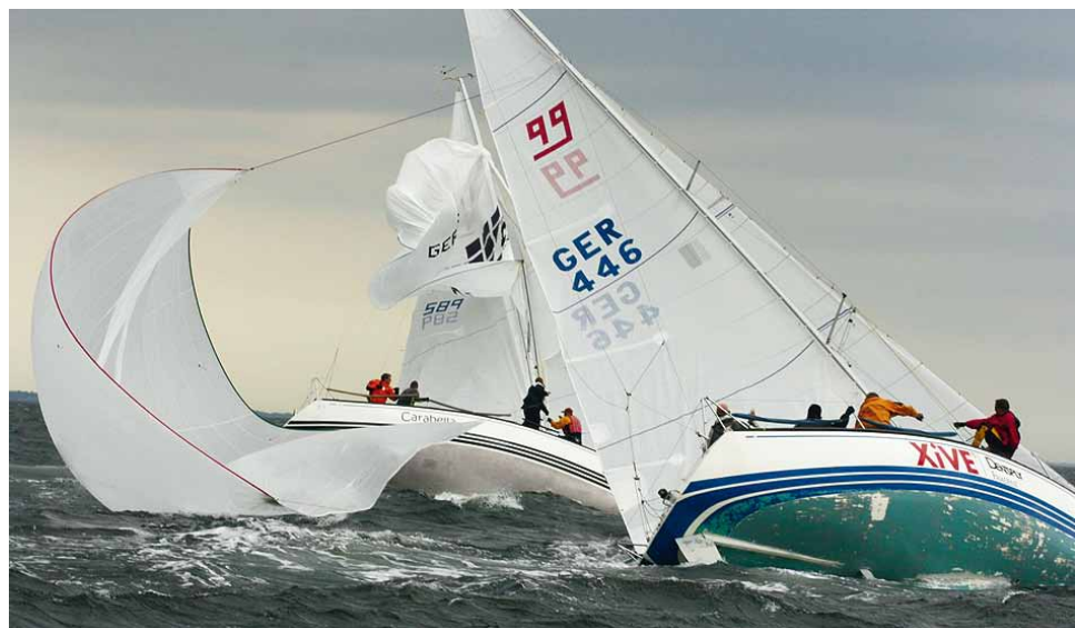
Bei entsprechenden Winden gibt es in der One Design Klasse der X-99 Yachten harte Kämpfe auf dem Bodensee vor ULTRAMARIN.

Vor allem die baugleichen Boote, die so genannten One-Design-Klassen, haben besonders strenge Vorschriften. Aus diesem Grund müssen sämtliche Starter gültiges Gewichtszertifikat und einen Messbrief von ihrem Schiff vorlegen. An den ersten beiden Tagen der X-99 WM werden die Yachten zudem gewogen, vermessen, die Segel und die einheitliche Ausrüstung kontrolliert. Dies dauert pro Schiff bis zu zwei Stunden. Dabei geht es sehr streng zu: Verwendet ein Teilnehmer ein nicht registriertes Segel, wird er samt Crew und Schiff disqualifiziert. Doch nicht nur das Schiff kommt auf die Waage, sondern auch jedes einzelne Crewmitglied.