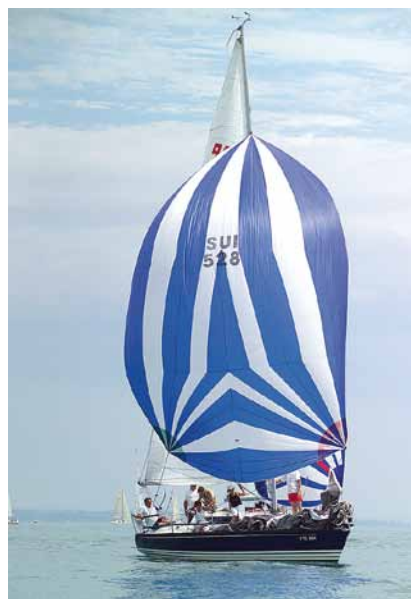
X-99 unter Spinnaker.