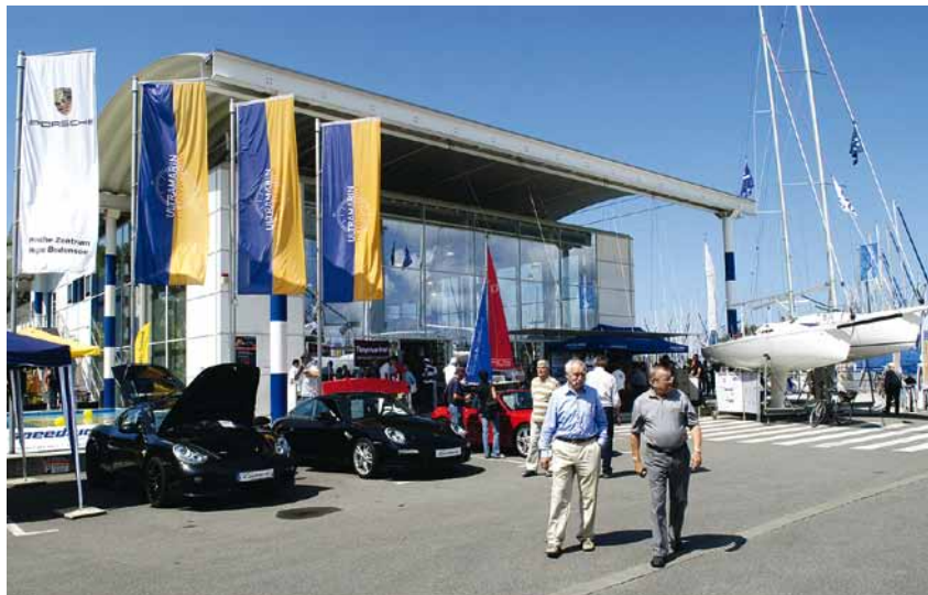
Staunen und Feiern: Das ULTRAMARIN-Hafenfest am 3. und 4. Juli lockt Wassersportfreunde und die Liebhaber der maritimen Atmosphäre in die Marina.

Informationen rund um das Angebot der größten Marina, Spiele und Kinderbetreuung, Festzelt-Stimmung, Livemusik und Frühschoppenkonzert, aber auch die im Hafenbecken liegenden über 30 X-99 Yachten der Weltmeisterschaft sind die großen Attraktionen des diesjährigen ULTRAMARIN-Hafenfestes. Am Samstag und Sonntag, 3. und 4. Juli, werden dazu über 5000 Besucher erwartet. Für die einzigartige, mediterrane Stimmung während des Festes sorgen die vielen Wassersportler, die mit ihren Segel- und Motorbooten über den See anreisen und in der Marina festmachen. Das Hafenfest bietet zudem den Nicht-Wasser-