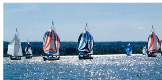
Unter den 33 startenden Schiffen sind auch viele mit Heimathafen Bodensee.