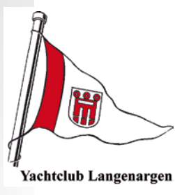
Der Yacht-Club Langenargen pflegt das Segeln mit alten Schiffen.