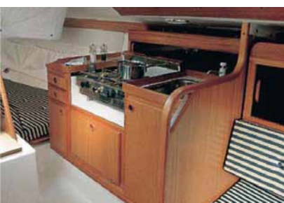
Komplette Ausstattung unter Deck.