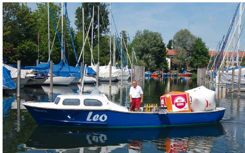
Die erfahrenen Bojenleger des Yachtclub Langenargen gelten als die schnellsten ihrer Art am Bodensee.