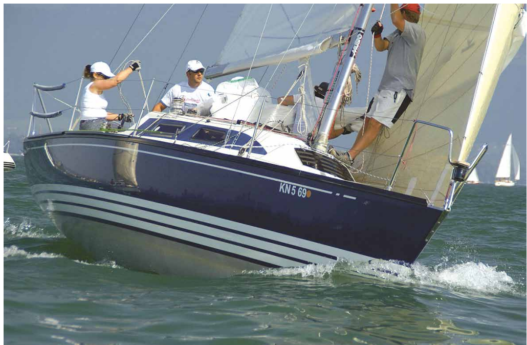
An Bord der X-99 Yachten sind auch gemischte Crews zu sehen. Das leichte Handling des Einheitsklassenbootes macht dies möglich.

vorgeschrieben. Das hohe Leistungsniveau in dieser Klasse, aber auch die besonderen Wetter und Windverhältnisse auf dem Bodensee werden für harte Segelmanöver und Spannung während der Regatten sorgen. Denn das Schiff verträgt sehr viel Wind, lässt sich aber auch bei Flaute gut segeln.